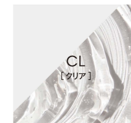
染色効果のないアイテム。

・実際の染め上がりの色は、地毛の色により多少異なります。また、印刷物ですので、実際の色とは多少異なります。・このカラーガイドは5分放置で染めたときの標準色です。 ・ブリーチのダメージによるカラーの吸い込みも考慮している為、特に寒色系は18レベルの方が濃い仕上がりがイメージになっています。