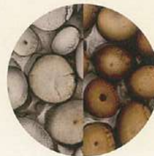
(毛髪断面写真 / 左:白髪 右:7-WNで染毛した毛髪)