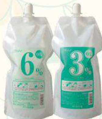
ミルフィ オキシ 6%/3%

染料を含まず透明感のあるLTとブラウン系染料の配合で染着力を落とさないUC/DCがミルフィカラーの明度を自在にコントロールします。 医薬部外品 120g