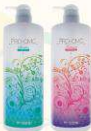
プロCMC シャンプー/トリートメント

パーマ・カラーの施術前後に髪を最適な状態にスタンバイする業務用シャンプー/トリートメントです。