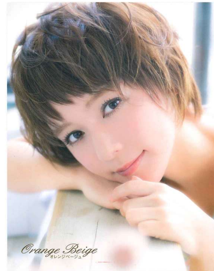
Orange Beige オレンジベージュ