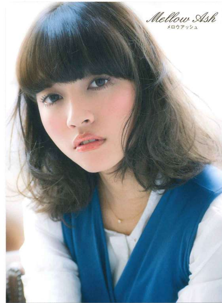
Mellow Ash メロウアッシュ

ウォーム系でツヤを、クール系で透け感を楽しむのも。 可愛く見せたいときにも、カッコよく装いたいときにも。 ファッションシェードラインはくすみの少ない色彩表現力で あらゆる“なりたい”をサポート。クリアな発色の染料 設計で明度操作や色相ミックスがしやすく、狙い通りの カラー表現を可能にします。